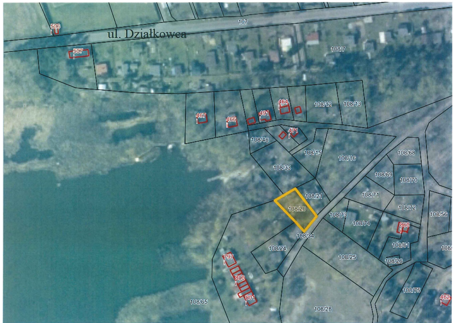
Działka nr 108/20 Januszkowice